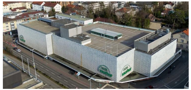
Galeria Kaufhof steht auf über einem halben Hektar Grundfläche zwischen Garten-, Karl- und Kaiserstraße, wie dieses Südwestpresse-Foto von Dimitri Drofitsch dokumentiert.