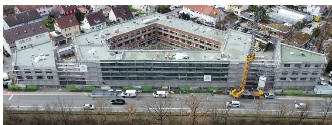
Das Quenta-Quartier an der Straße zwischen Reutlingen und Sondelfingen ist eines der Großvorhaben der GWG.